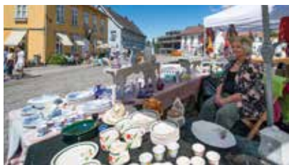
Drøbak 2017: Sommer og salg