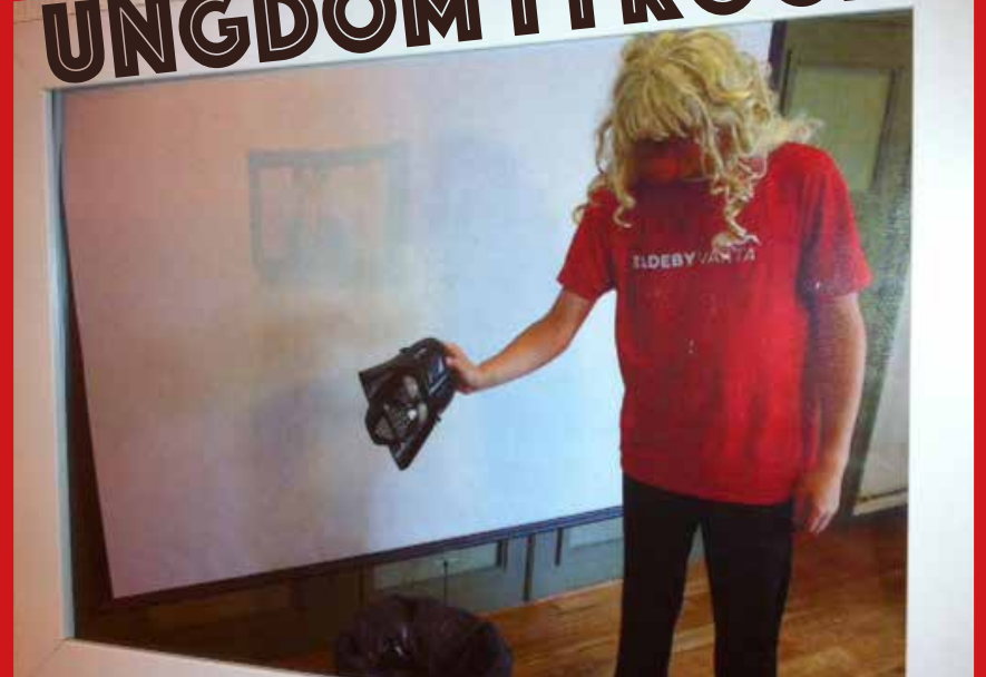
"I søpla med den" - foto: Benjamin Rødberg"