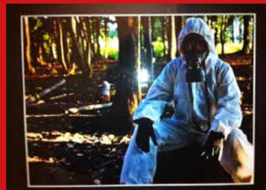
"Innestengt - utestengt"

Også de unge i Frogn er utfordret til å «kaste maska» under Verdensdagen for psykisk helse – og det skal resultere i en fotoutstilling i Drøbak kino 20. oktober. Her er to av bildene som blir stilt ut.