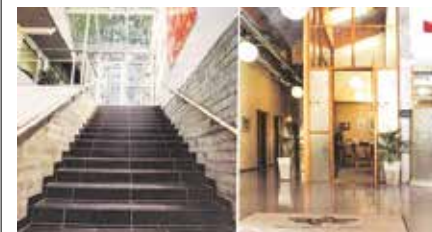
Luftambulansens gamle bygg blir ny base for den IKT-enheten for Ås, Vestby og Frogn.

Samarbeidskommunene Vestby, Ås og Frogn skal gå sammen for å levere gode IKT-tjenester og service til alle ansatte og brukere i de tre kommunene. Den nye enheten lander snart på Luftambulansens gamle lokaler ved Drøbak city.