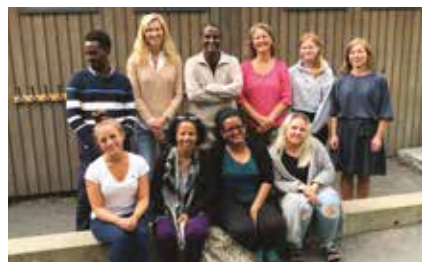
Luftambulansens gamle bygg blir ny base for den IKT-enheten for Ås, Vestby og Frogn.

Fire pedagoger har vært gjennom en teoretisk utdanning i Montessori pedagogikk i Addis Abeba, før de kom til Norge for å få en opplevelse av hvordan vi praktiserer, organiserer og drifter