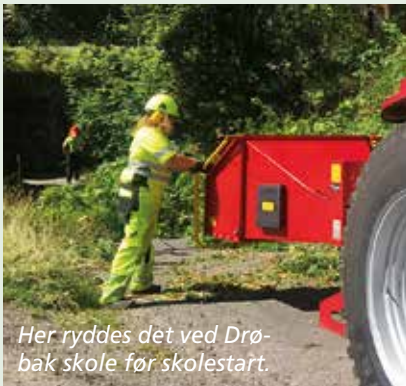
Her ryddes det ved Drøbak skole før skolestart.