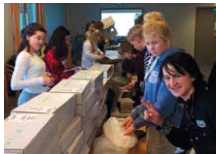
Fra utrulling av Surface til Dyrløkkeåsen skole i vår.

– Vi har fortsatt en del arbeid igjen med å systematisere distribusjon av applikasjoner på en god og effektiv måte ut til elevenes nettbrett. Vi ønsker å korte ned tiden det tar før nye apper er tilgjengelig på elevenes nettbrett.