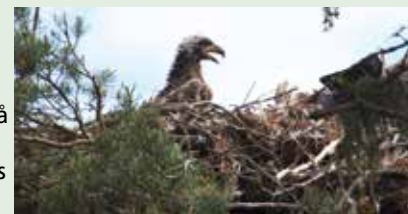
Ringmerking av havørnunge på Håøya i 2015

Havørna er observert i nærheten av reiret på Håøya i Drøbaksundet, og vi håper at nye unger skal fly ut fra reiret også i sommer. For å sikre dette er det viktig at ørna ikke blir forstyrret. Statens naturoppsyn setter i disse dager opp skilt som viser hensynsområdet der man ikke bør ferdes jf. naturmangfoldloven §6. Mer informasjon finnes på kommunens hjemmeside. Her vil vi også legge ut informasjon om årets havørnhekkning. Mer informasjon finnes på kommunens hjemmeside. Her vil vi også legge ut informasjon om årets havørnhekkning.