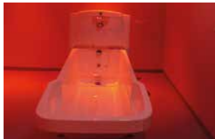
Spa med bad i ulikt fargevalg.