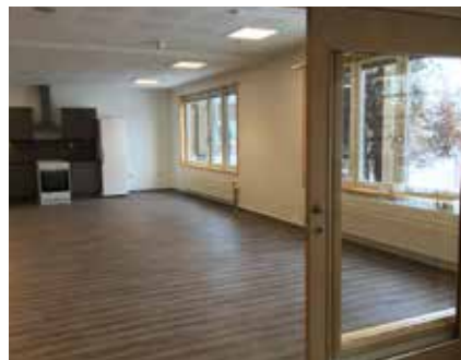
Det nye dagsenteret blir lyst og fint.

glede mange av innbyggere i Frogn kommune. Det vil også bli bygd en bro over Raskebekken, og etablert en tursti opp til museet.