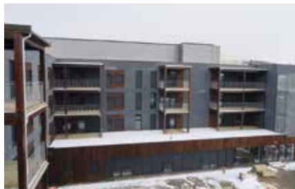
Tre etasjer med beboerrom – og stor takterrasse der sengene kan trilles ut.