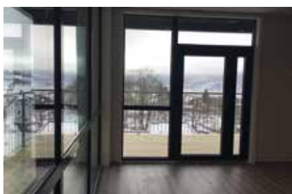
Syv rom deler felles stue og kjøkken med stor terrasse utenfor.