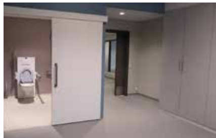
Store og luftige beboerrom har alle egne bad.