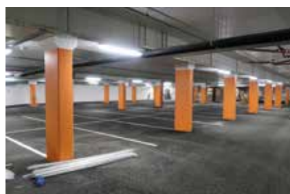
Underetasjen rommer 60 parkeringsplasser til ansatte og besøkende.