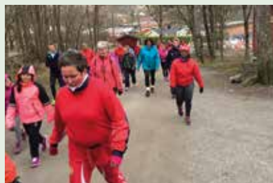
Friskliv med Kom-i-form!