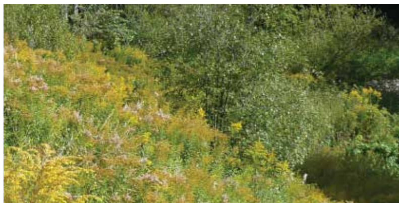
56 prosent av artene på fremmedartslista har spredd seg til naturen fra det området de er satt ut på. Majoriteten av disse er planter som forviller seg fra hager. Kanadagullris er en av dem.

Fremmedarter fra din hage skal pakkes inn i plast og dekkes godt til på vei mot kvistmottaket så plantene ikke sprer sine frø eller planterester på veien, plastposene leveres på anvist sted. Jord med frø/plantedeler/røtter fra disse, kan leveres på mottaket i egen container.