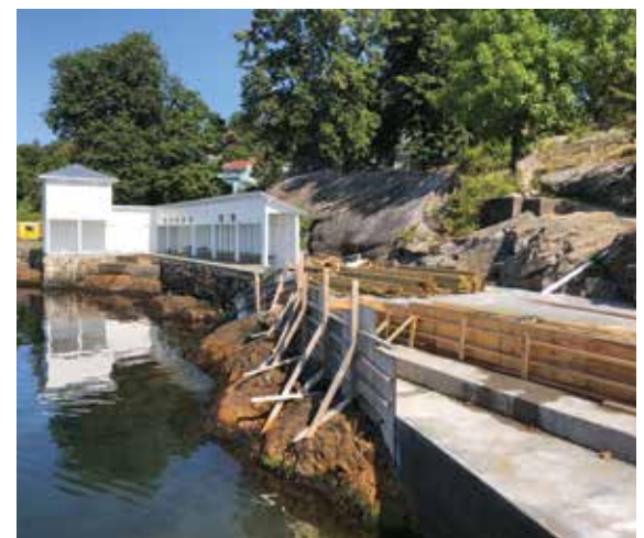
Om noen uker er sperringer og plankehauger borte og parken klar til bruk. Vi gleder oss!